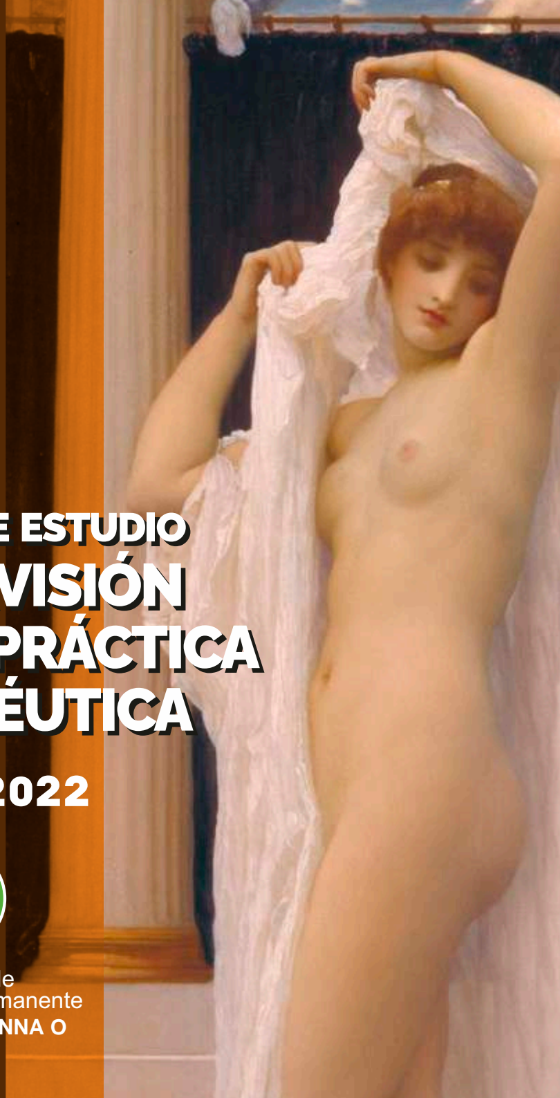
Imagen: El baño de Psique Frederic Leighton 1889

espacio de formación permanente fundación ANNA O