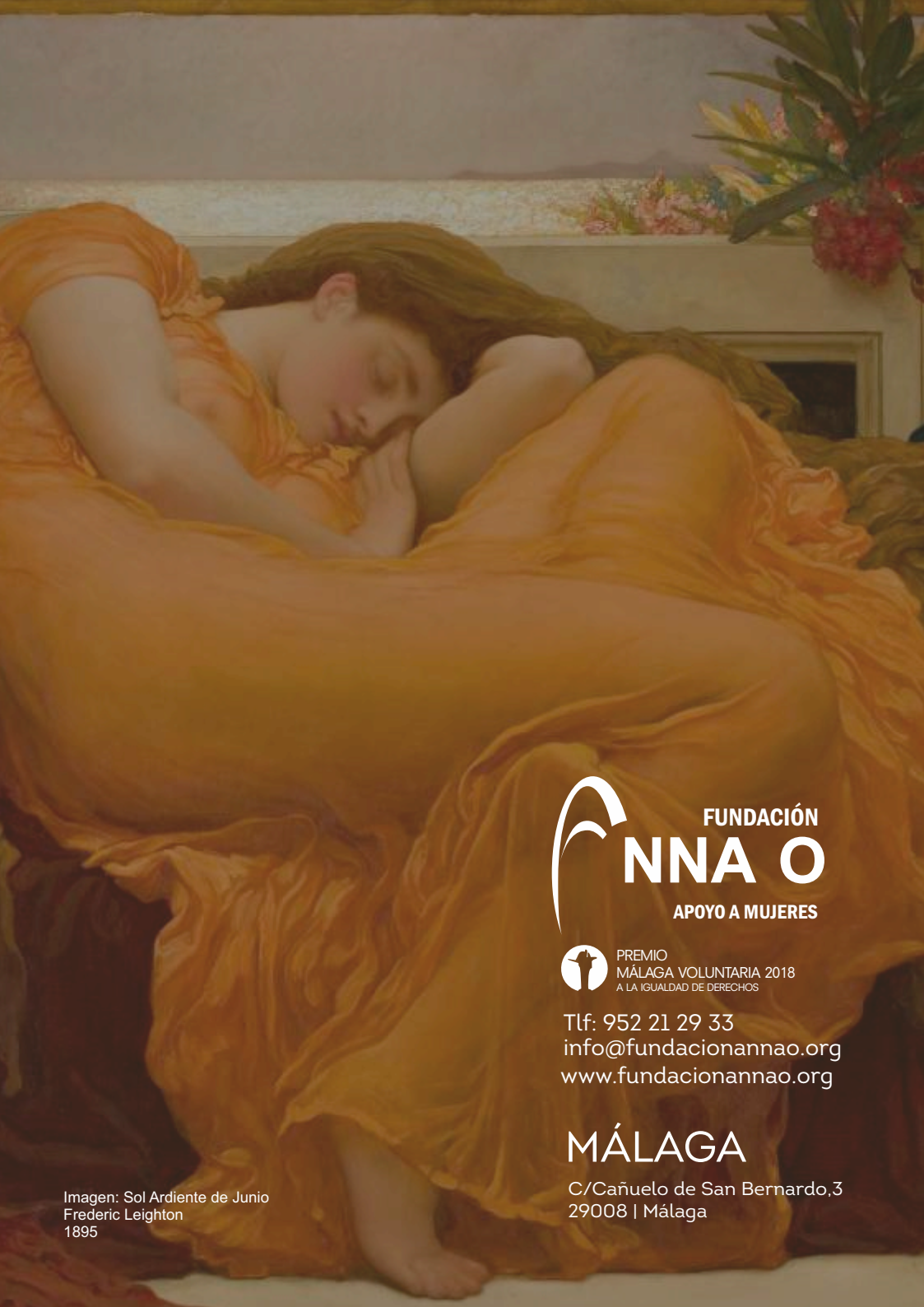
Imagen: Sol Ardiente de Junio Frederic Leighton 1895